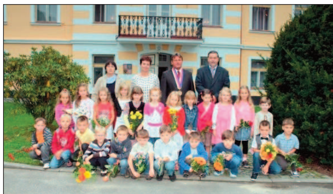
Prvňáčci se rozloučili se školkou