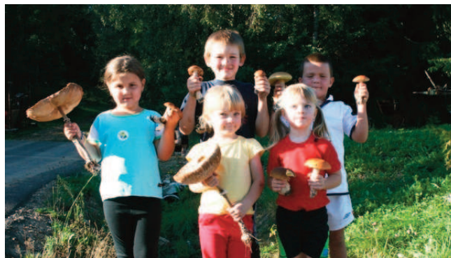
Děti z Outdoor Kids nejenom sportují

Jaro a léto bylo pro děti našeho oddílu ve znamení horských kol. Děti již dvacetičlenného klubu Outdoor Kids Čkyně vyrazily na cyklovýlety, ale absolvovaly také celý seriál závodů Jihočesko-Bavorského seriálu na horských kolech. Během závodů nasbíraly i řadu medailí, které povzbudily celý oddíl. Kola jsme už pomalu pověsili na hřebíčky a začínáme běhat po svých. Běh v terénu, různé hry, sbírání hub, soutěže a horská turistika po šumavských tisícovkách, to je náplň podzimu. Stejně jako léto, tak i podzim se vyznačuje řadou závodů. Většina z nich se uskuteční v září v přespolním běhu a účastní se jich všechny naše děti, které jsou ve věku od 4 do 12 let. I v běhu získáváme v silné konkurenci medaile a poháry, kterými si děti zdobí své pokojíčky.