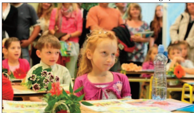
Poprvé ve školních lavicích